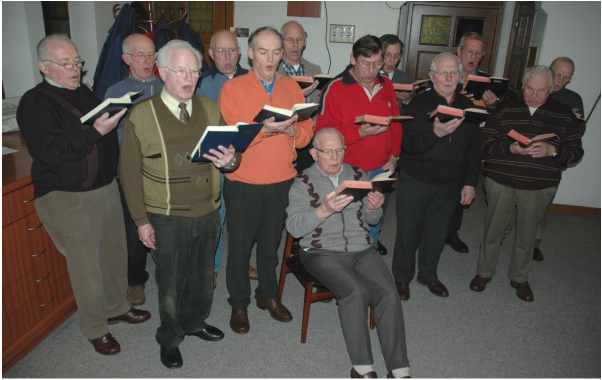
een foto van het Herenkoor (± 2010) tijdens een repetitie in de sacristie.