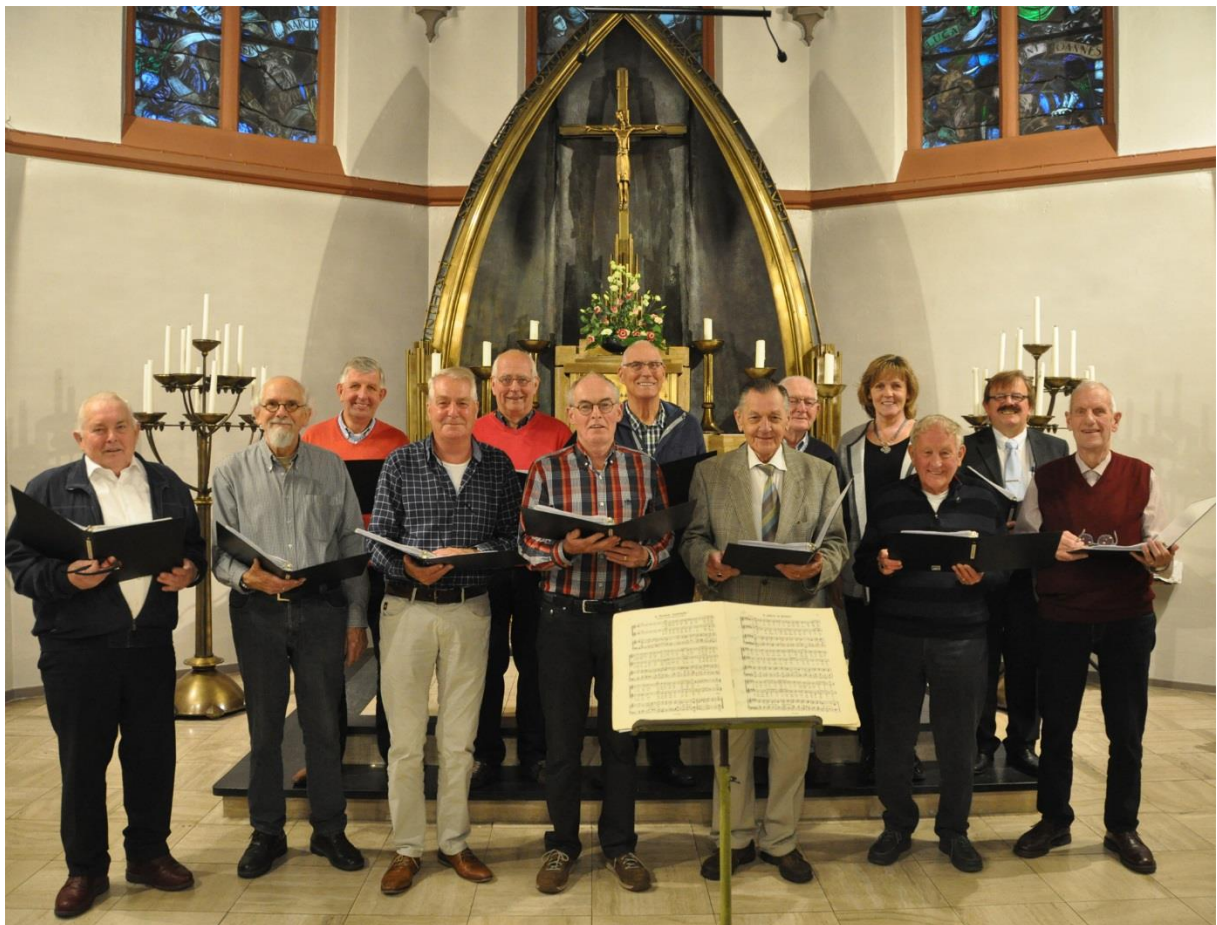
Herenkoor oktober 2016